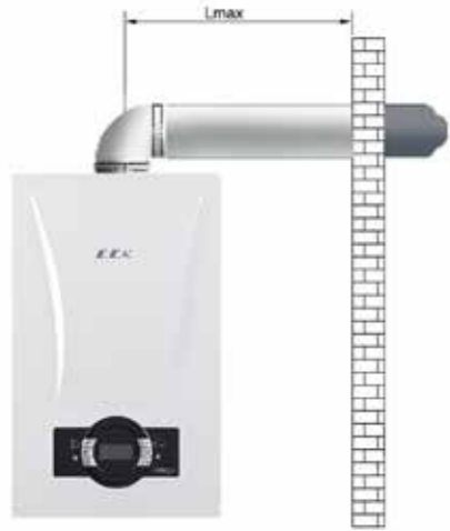
Aplicación de conducto hermético horizontal L máx. distancia con codo simple: 10 m, Ø60/100 L máx. distancia con codo simple: 20 m, Ø80/125